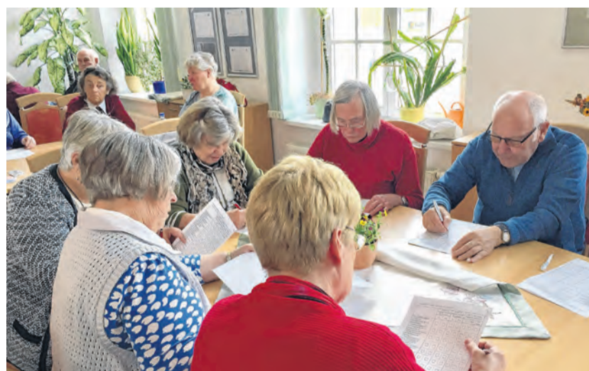
Rege Teilnahme an der gemeinsamen Befragung von Seniorenbeirat und Stadt Neubrandenburg

Eine Befragung zur Nutzung der städtisch geförderten Seniorenbegegnungsstätten und Mehrgenerationenhäuser ist nun beendet.