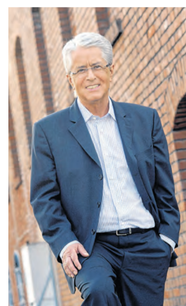
Frank Elstner