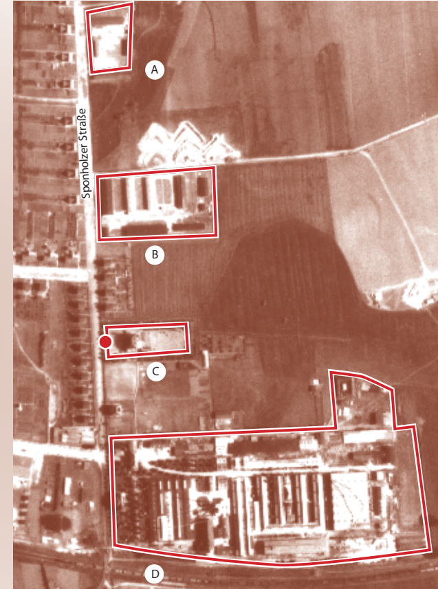
Luftbild der Royal Air Force (Juni 1944) ● Standort Informationsstele 3

Am südöstlichen Ende der Ihlenfelder Vorstadt befand sich das 1925 in Neubrandenburg errichtete alteingesessene Holzverarbeitungswerk Richard Rinker KG, das ab 1933 Rüstungsgüter produzierte. Für die Produktionssteigerung wurden Kriegsgefangene und verschleppte Zivilkräfte aus Holland, Frankreich sowie der Sowjetunion als Zwangsarbeiter eingesetzt.