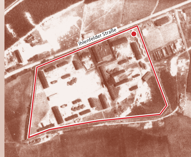
Luftbild der Royal Air Force (Juni 1944) ● Standort Informationsstele 2