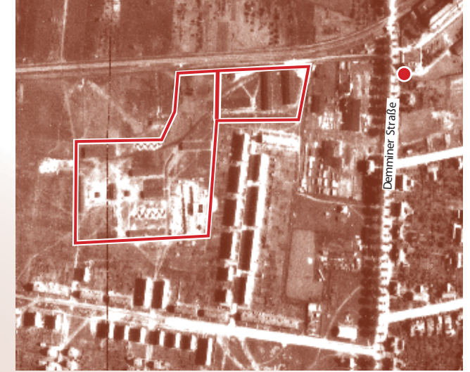
Luftbild der Royal Air Force (Juni 1944) ● Standort Informationsstele 4

Von 1943 bis 1945 befand sich auf dem nördlichen Gelände des heutigen Vogelviertels das Zwangsarbeiterlager West der Mechanischen Werkstätten Neubrandenburg. Die unter anderem aus Polen, Holland, Frankreich, Belgien und der Sowjetunion stammenden Arbeitskräfte wurden für die Fertigung von Rüstungsgütern eingesetzt.