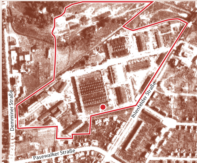
Luftbild der Royal Air Force (Juni 1944) ● Standort Informationsstele 1

1934 gründete der Berliner Unternehmer Curt Heber in Neubrandenburg zwischen Demminer und Wolgaster Straße ein Rüstungswerk, das nach der Verstaatlichung 1937 Mechanische Werkstätten Neubrandenburg GmbH (MWN) genannt wurde. Der Betrieb besaß eine Fläche von ca. 41.000 qm und hatte Ende 1943 über 6.000 Beschäftigte, für die in der Ihlenfelder Vorstadt zahlreiche Wohnhäuser im typischen NS-Heimatsstil mit ziegelsteinsichtigen Fassaden und Satteldach erbaut worden waren.